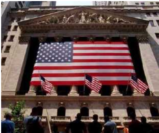
New York Stock Exchange

Wollen Sie wissen, wo die Menschen viel, viel Geld machen? Aber auch verlieren? Wall Street und die New Yorker Börse sind Synonyme für die Macht des Mammons. Man kann die Börse besuchen und von der Galerie aus die Händler beobachten. Ganz nebenbei kann man sich über den Aktienhandel informieren.