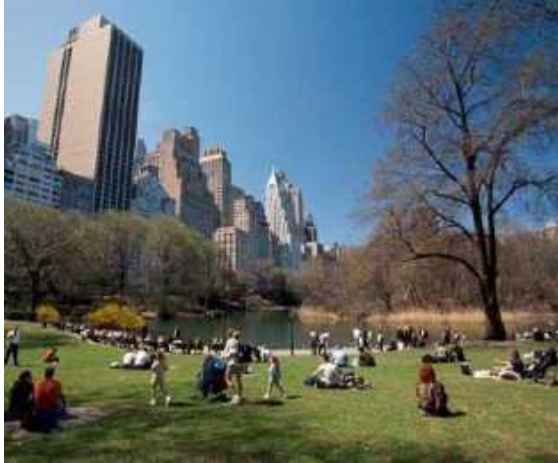
Central Park und die Geschichte

Die Verwaltung von Central Park bietet ganzjährig mittwochs und samstags Gratis-Führungen zu verschiedenen Themen an. Etwa: „Waterways and Vistas“ oder „Manhattan Adirondacks“. Geschichte, Ökologie und die Landschaftsarchitektur stehen dabei im Mittelpunkt.