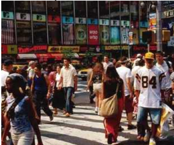
Times Square durchleuchtet

Die Lichter der Großstadt – wo könnte man sie eindrucksvoller erleben als am Times Square? Was dieser traditionsreiche Platz und der Broadway so alles schon erlebt haben, erfährt man während einer 90-minütigen Gratis-Tour der Vereinigung Times Square Business Improvement District.