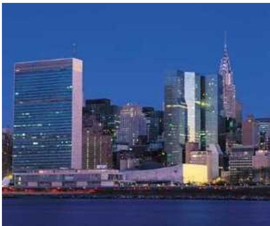
Midtown Manhattan kennen lernen

Das Viertel rund um Grand Central Station gehört zu Midtown Manhattan. Hier wohnt Manhattans Mittelstand, entlang der Park Avenue natürlich die Superreichen. Wer