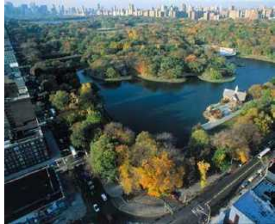
Terrasse mit Aussicht

Als Geheimtipp für die beste Sicht auf Central Park und die umliegenden Wolkenkratzer gilt der Iris and B. Gerald Cantor Roof Garden im Metropolitan Museum of Art. Der Dachgarten ist ideal, um bei einem Cappuccino und Brownies New York zu genießen.